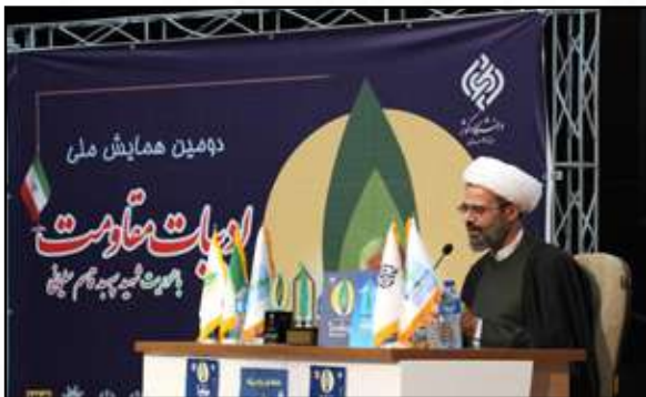
حجت الاسلام و المسلمین نوری نماینده محترم ولی فقیه در استان خراسان شمالی و امام جمعه بجنورد