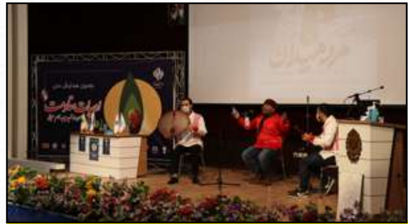
گروه موسیقی ژبار