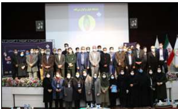
اختتامیه دومین همایش ملی ادبیات مقاومت