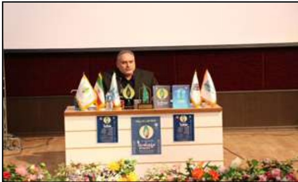
آقای افشین علاء شاعر مطرح و برجسته کشور