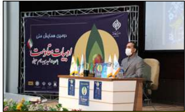
دکتر علی بیگزاده معاون محترم توسعه مدیریت و منابع استانداری خراسان شمالی