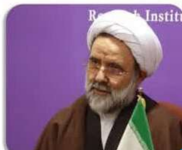
بازدید مدیران و اعضای هیأت علمی گروه معارف دانشگاه جامع امام حسین (ع)