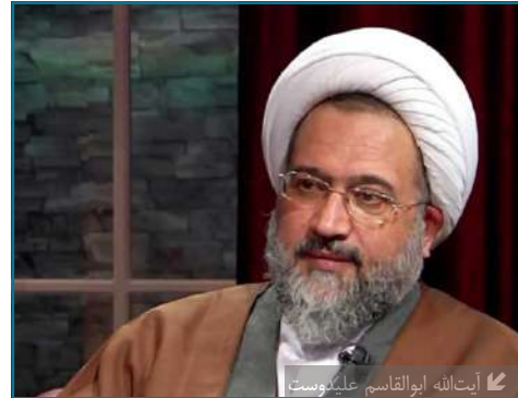
آیت‌الله ابوالقاسم علی‌دوست

آیت‌الله ابوالقاسم علی‌دوست عضو هیأت علمی گروه فقه و حقوق پژوهشگاه به مناسبت هفته پژوهش طی نشست در جمع پژوهشگران پژوهشگاه فقه معاصر پیرامون بایسته‌ها و مراحل پژوهش‌های فقهی به ارائه بحث پرداخت و گفت: ما در ارتباط با هر دانشی سه مرحله داریم؛ نخست مرحله‌ی اطلاعات است که انسان کسب اطلاعات می‌کند.