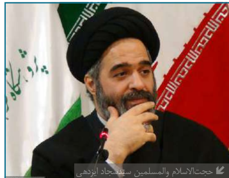
حجت‌الاسلام والمسلمین سیدمجتهد ایزدهی

سیدمجتبی میرلوحی معروف به نواب، بنیانگذار و رهبر «جمعیت فدائیان اسلام» است که از او کتاب «راهنمای حقایق» هم به یادگار مانده که در آن بتشریح مختصات یک «حکومت اسلامی» می‌پردازد. او به دلیل داشتن رویکرد انقلابی، دینی، ملی و امت محوری، بی‌شک حرکتی رو به جلو را در تاریخ معاصر رقم زد و نقش و عاملیت او در تحولات ملی و دینی غیرانکار است.