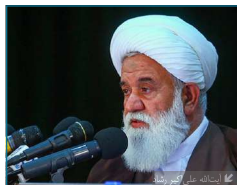
آیت‌الله علی‌اکبر رشاد

آیت‌الله علی‌اکبر رشاد در اختتامیه سومین همایش "علوم انسانی - اسلامی، پژوهش و فناوری" که در تالار شهید سلیمانی پژوهشگاه علوم و فرهنگ اسلامی برگزار شد در سخنانی بصورت برخط با تأکید بر ضرورت تقسیم کار گفت: با دستور کاری دقیق و تقسیم کار میان پژوهشگاه‌ها می‌توانیم به سمت ارتقاء جایگاه علوم انسانی - اسلامی قدم برداریم.