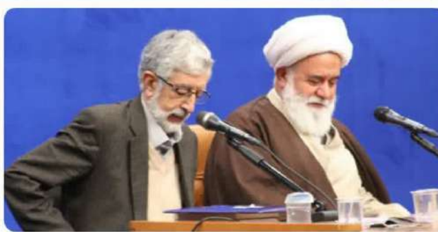
کمیسیون فلسفه، کلام، ادیان و فلسفه دین همایش بین‌المللی استاد فکر علامه مصباح