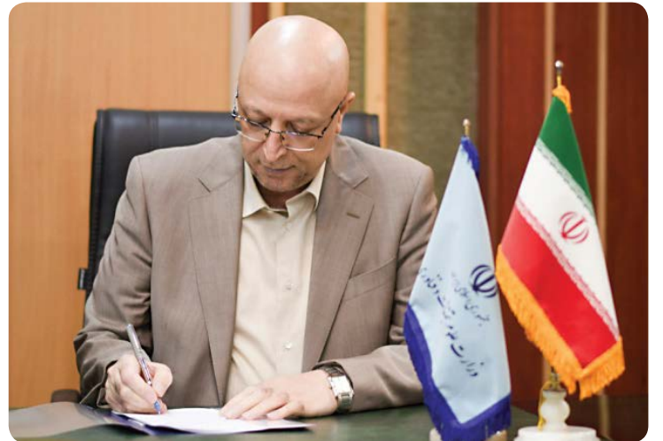
معاون امور آزمون‌های سازمان سنجش آموزش کشور، خبر داد:

«دانشگاه یکی از اصلی‌ترین محورهای تمدن‌سازی و تحقق جامعه مبتنی بر دانایی و خرد و حکمت است و توجه به کیفیت در آموزش عالی، از لوازم